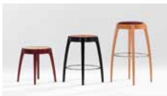
AD-981C-P AD-981B-P AD-981A-A

AD-981A-P / AD-981B-P / AD-981C-P 座: 成型合板 ビーチ突板(全13色) フレーム: ビーチ材(全13色) 足掛: スチールロッド(クロームメッキ)