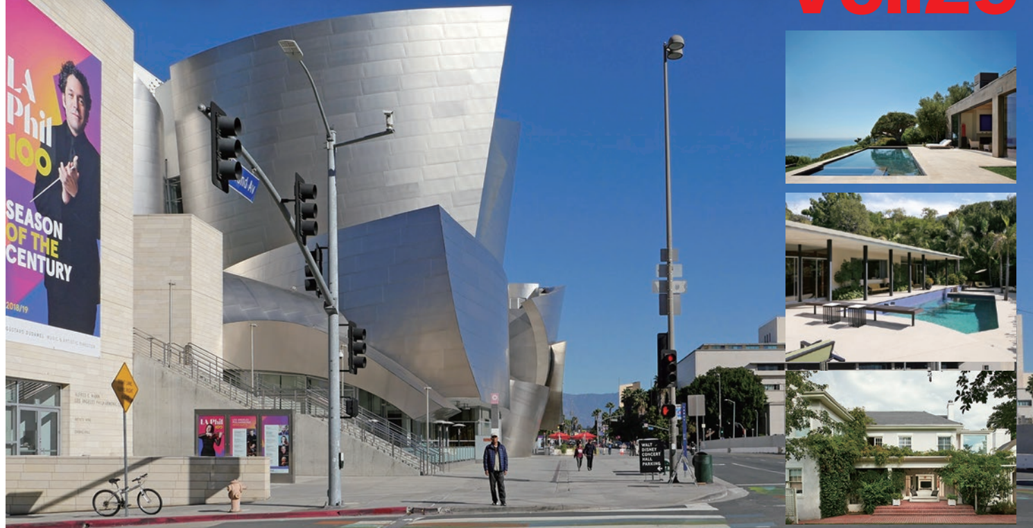
Photo shoot house report Seminar 2026 新春 アメリカ西海岸撮影建築レポート Vol.29

エーディコア・ディバイズでは 2007 年からアメリカ西海岸でカタログ撮影を続けました。2026 年の新春セミナーではその撮影に歴史を振り返りながら有名建築での撮影の模様をお届けます。