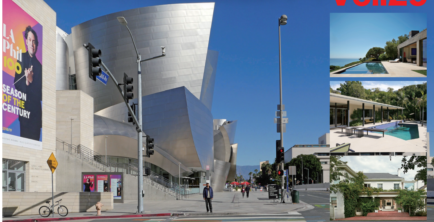
Photo shoot house report Seminar 2026 新春 アメリカ西海岸撮影建築レポート Vol.29

エーディコア・ディバイズでは 2007 年からアメリカ西海岸でカタログ撮影を続けました。2026 年の新春セミナーではその撮影に歴史を振り返りながら有名建築での撮影の模様をお届けます。