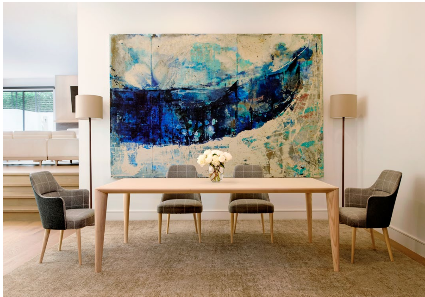
MD-901S (WO-26/WO-47)D-5 MD-901A (WO-26/WO-47)D-5 MD-905-210 D-5 RA-071H-NCV-S

MD-905-180 W1500×D900×H720(1.50)_Y282,000 MD-905-180 W1800×D900×H720(1.50)_Y288,000 MD-905-210 W2100×D900×H720(1.50)_Y328,000