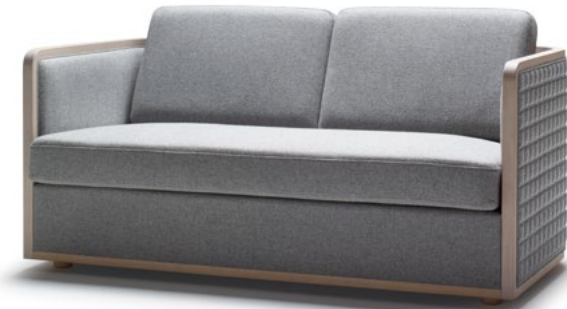
NC-065-2P ds(WO-35 + V5-35)D-5