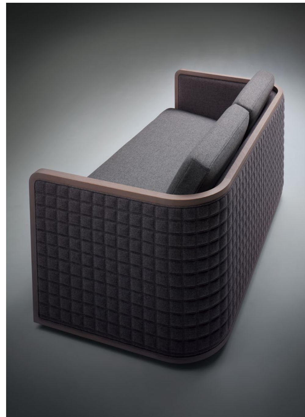
NC-065-2P ds(WO-35 + V5-35)D-5