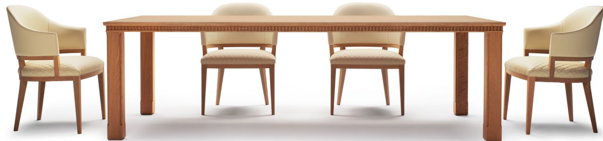
NC-061A ecc(特別仕様:PL-86 + CS-86) D-1 NC-062-240 D-1