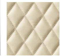
ecc: 特別仕様 座面のみクロスステッチレザー

NC-061A W590 × D585 × H800(SH450)_Y134,000--