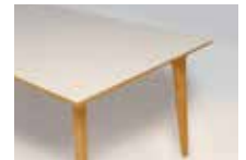
バイオマーブル天板