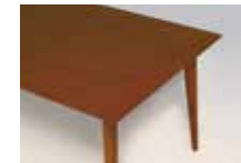
ホワイトアッシュ突板天板