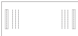
MD-107-210 W2100・D950・H720(t 50)