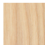
①ホワイトアッシュ

ミニマリズムを追求した、シンプルなダイニングテーブルです。脚部は厚み45ミリのホワイトアッシュ材。対角線状に向いた脚部は、面と面・曲線とテーパー処理の組み合わせにより、贅肉をそぎ落とした構造にテーブルとしてのデザイン性を加味しています。