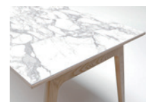
C: 大理石模様セラミック天板(白)