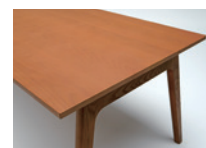
W: ホワイトアッシュ突板天板