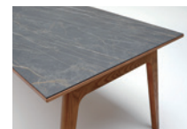
C: 大理石模様セラミック天板(黒)