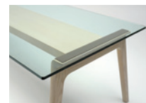
G: クリアガラス天板 (15ミリ)