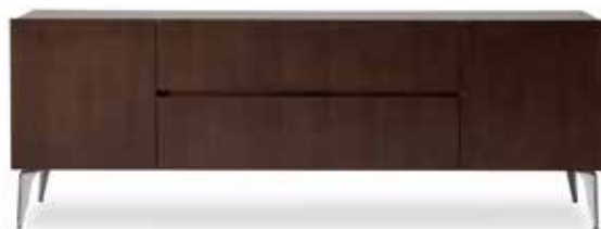
CA-001 ③ AL / N-8