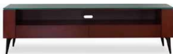
CA-016W-HC (GF) AB / N-5