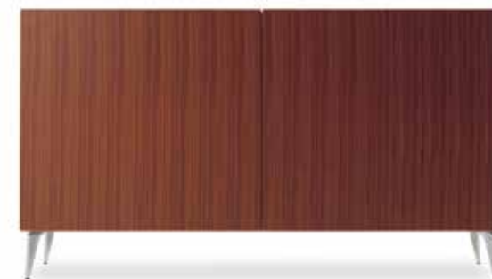
CA-012L ⑥ AL