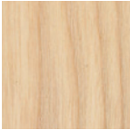
①ホホワイトアッシュ

無垢のホホワイトアッシュ材を使用した贅沢なダイニングテーブルです。無垢の素材感を活かした天板はW2100／W1800／W1500のバリエーションをご用意しています。シンプルで軽快なデザインの脚部は脚位置を移動する事ができ、様々なシーンでのご使用が可能です。無垢材の動きを考慮しながら、ソリッド感溢れるデザインは考え抜かれた構造体から生まれました。