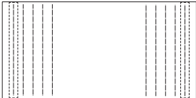
MD-207-180 W1800・D900・H720(t 40)