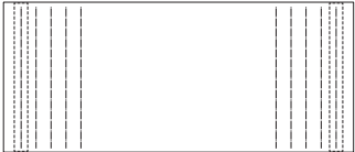
MD-207-210 W2100・D900・H720(t 40)