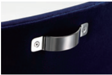
MD-201-OH オプションハンドル MD-201 チェアに、便利なオプション ハンドルをご用意しました。