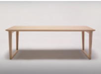
MD-207-210 脚部移動取付バリエーション