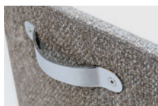
MD-202-H-OP オプションハンドル

MD-202 チェアに、便利なオプションハンドルをご用意しました。スチールにクロームメッキ仕上げの持ち上げやすいハンドルです。