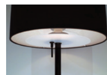
調光機能付スイッチ