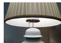
調光機能付スイッチ